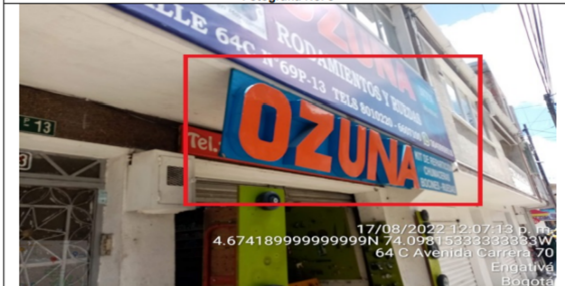
Fotografía No. 3

En la cual se evidencia un (1) elemento tipo aviso en fachada, perteneciente al establecimiento comercial denominado OZUNA RODAMIENTOS Y RUEDAS , el cual se encuentra volado de la fachada y es adicional al único elemento permitido por fachada de establecimiento.